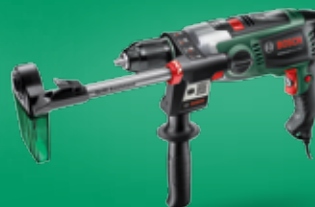
UniversalImpact 700 s pomagalom za bušenje