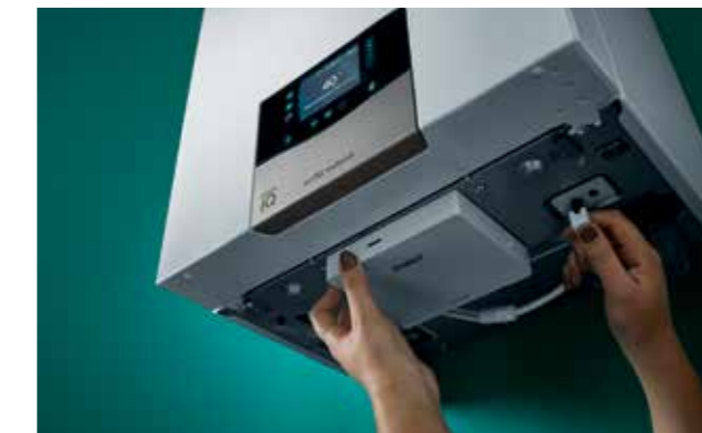
Instalirajte sustav sensoNET u tren oka

Crno: osnovni sustav s uređajem ecoTEC exclusive, sensoCOMFORT VRT 720 i spremnikom za toplu vodu Sivo: opcionalni dodaci - sobni korektori VR 92, modul za hidrauličko proširivanje VR 71, solarna priprema tople vode za kućanstvo i komunikacijska jedinica sensoNET VR 921 za upravljanje aplikacijom i daljinsku dijagnostiku